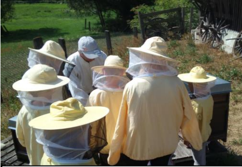
بچه ها همکاری خوبی از زنبورها یاد گرفتند.

برگزار شده بود. 14 کودک و 6 Schullandheim Reibitz همان طور که برنامه ریزی شده، در تعطیلات کودکان امسال چند کارمند حضور داشتند. مانند همیشه، این هفته تعهد کامل تمام کارکنان را به عهده داشت و با این حال این فقط خوب بود. خلاصه همه چیز درست بعد از: "این کار مثل یک مسابقه بود. ما کاملاً خسته شدیم و همچنان در زمان تمام بود، احساس