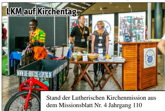
Stand der Lutherischen Kirchenmission aus dem Missionsblatt Nr. 4 Jahrgang 110

Der Kirchentag der SELK stand unter dem Leitwort: „Salz der Erde, Licht der Welt“. Unsere persischen Gemeindeglieder haben während eines Workshops eine Theateraufführung vorgestellt, bei dem die vielen Sprachen zu Pfingsten gesprochen wurden. Im Workshop haben wir in Farsi und Deutsch die Herausforderung und den