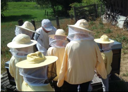
Kinder beobachten gute Zusammenarbeit bei den Bienen.