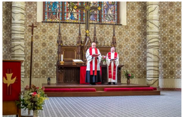
اسقف وقت محراب را تبرک کرد (چ) کشیش فیشر (ر)