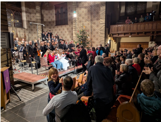
Weihnachtsoratorium für Kinder