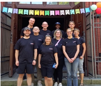
چپ به راست

مردم داشتیم و اولین ثمره این هفته این است که مردم می خواهند بدانند در آینده چه جور خواهد بود. سؤالاتی از این قبیل مطرح شد، ما این خدمات را در جلوی کلیسا دوست داریم! نمی توانید هر هفته آن را داشته باشید؟ یا من می خواهم غسل تعمید بگیرم! می توانید به من بگویید هزینه آن چقدر است؟ یا سؤالاتی که مربوط به زندگی روزمره در بروکه و انجمن است. شما کدام کلیسا هستید؟ منظور از باشگاه نوجوانان و باشگاه کودکان چیست؟