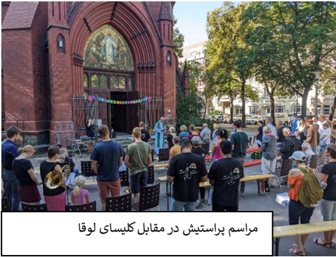
مراسم پراستیش در مقابل کلیسای لوقا

برخی از سوالات عمیقاً ما را تحت تأثیر قرار داد. مثلاً گروهی از بچه های مسلمان به کلیسا آمدند. آنها در ابتدا تردید داشتند زیرا فکر می کردند که رفتن به کلیسا ممنوع است. اما بعد می خواستند همه چیز را بدانند. با کمال تعجب، آنها فریاد زدند: عیسی واقعاً اگر «مردا» من فکر کردم شخص دیگری است! یا عیسی به تنهایی می تواند گناهان ما را فدیہ کند، «باید به همه بگوییم! چرا ما این کار را نمی کنیم؟» همه اینها به ما نشان می دهد که جشنواره منطقه امسال دقیقاً به آنچه برنامه ریزی کرده بودیم رسید: