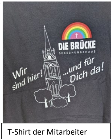
T-Shirt der Mitarbeiter